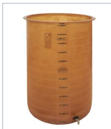
CONTENITORE CILINDRICO A FONDO PIATTO

SEMPREPIENI CON GALLEGGIANTE AD OLIO IN VETRORESINA , corredati di: coperchio e galleggiante ad olio in vetroresina; valvola di prelievo in bronzo cromato DN 15 fino alla capacità di 300 lt e DN 25 per le capacità superiori.