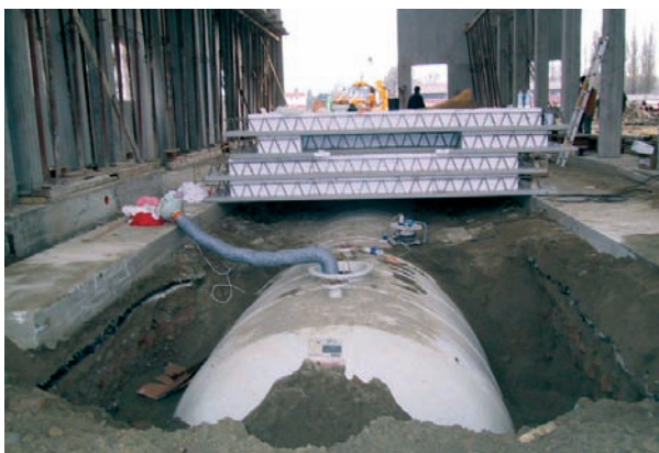
Impianto antincendio Centro Olimpico TORINO 2006, costituito da due cisterne da interro serie acqua in vetroresina. Capacità specifica di 50 mc.

40 anni di esperienza nella lavorazione e l'impegno costante nella ricerca e sviluppo, permettono a ORM di offrire la massima collaborazione per la soluzione di problemi connessi all'impiantistica per ogni tipo di industria. Su richiesta si realizzano serbatoi su specifiche tecniche del cliente e accessoriati con ogni tipo di raccorderia.