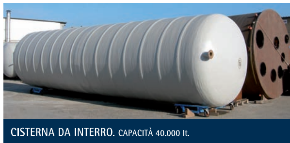
CISTERNA DA INTERRO. CAPACITÀ 40.000 lt.

Le cisterne orizzontali ORM trovano largo impiego nell'industria chimica e alimentare. Sono realizzate per soddisfare le più svariate esigenze di stoccaggio di liquidi, grazie ad una vasta gamma di soluzioni diversificate per capacità (da 1000 a 80000 lt), per configurazione geometrica e per tipologia di posa (da stoccaggio e da interro). Le caratteristiche dimensionali e le modalità di posa sono le medesime delle cisterne orizzontali per acqua (vedi pag. 6).