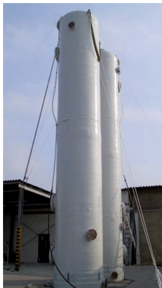
COLONNE DI STRIPPAGGIO. ALTEZZA 11 m.

Le cisterne verticali ORM trovano largo impiego nell'industria chimica e alimentare. Sono realizzate per soddisfare le più svariate esigenze di stoccaggio di liquidi, grazie ad una vasta gamma di soluzioni diversificate per capacità (da 2500 a 50000 lt) e per configurazione geometrica (fondo piatto e fondo bombato). Le caratteristiche dimensionali sono le medesime delle cisterne verticali per enologia (vedi pag. 13).