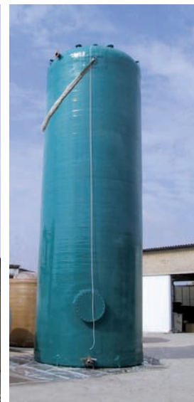
CISTERNA VERTICALE A FONDO PIATTO. CAPACITÀ 65.000 lt.