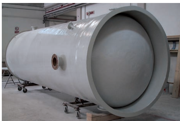
CISTERNA VERTICALE A FONDO BOMBATO IN PRESSIONE. CAPACITÀ 7.500 lt.