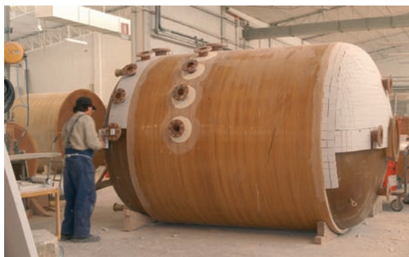
FASE DI ESECUZIONE