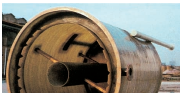
SEDIMENTATORE STATICO (VISTA INTERNA)